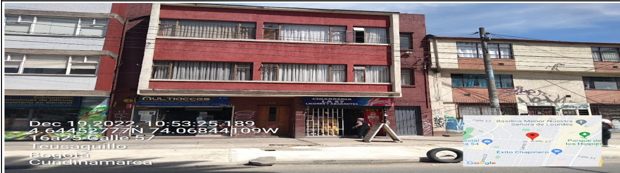
Fotografía No. 1

Vista panorámica del predio en el que se sitúa el establecimiento comercial denominado CIGARRERÍA JARAMILLO LA 57 ubicado en la CL 57 No. 16 A – 24 .