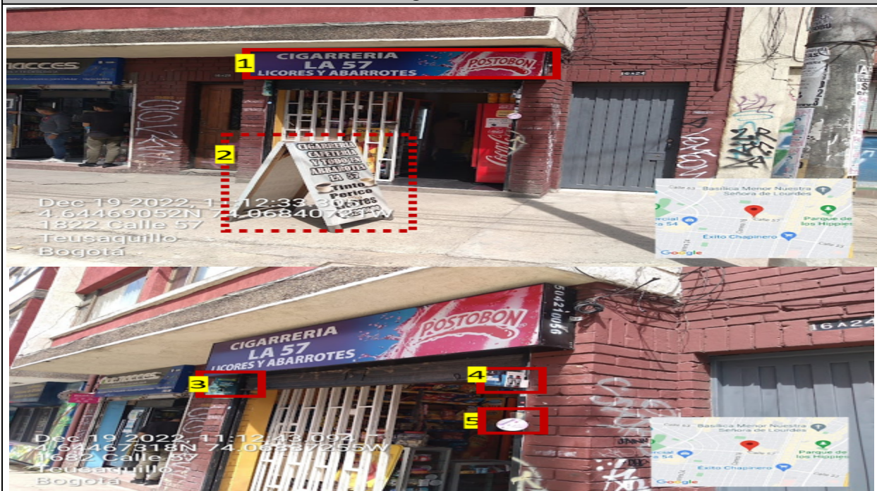
Fotografía No. 2

En la que se puede evidenciar: un elemento tipo “aviso en fachada” instalado sin contar con el registro ante la Secretaría Distrital de Ambiente , identificado con el número 1. De igual forma se observa cuatro (4) elementos publicitarios adicionales con relación al único permitido por fachada de establecimiento identificados con los números 2, 3, 4 y 5, los elementos 3, 4 y 5 se encuentran sin adosar (volados) a la fachada y el elemento 2 “no regulado” se encuentra instalado en área que constituye espacio público.